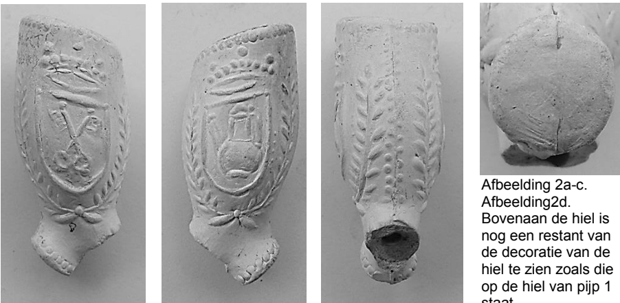
Afbeelding 2a-c. Afbeelding 2d. Bovenaan de hiel is nog een restant van de decoratie van de hiel te zien zoals die op de hiel van pijp 1 staat.

Pijp 2: Deze pijp heeft aan een zijde de sleutels, het Wapen van Leiden, in een schild met daarboven een uit twee lijnen en punten bestaande kroon en aan de andere zijde de kan in een schild met eveneens een uit twee lijnen en punten bestaande kroon daarboven. Aan beide zijden van de schilden zijn bladertakken aangebracht en ook de vormnaad is van een visgraadmotief voorzien. Nauwkeurige analyse van de twee helften van deze pijp leert dat, de zijde afgebeeld op afbeelding 2a met de sleutels, identiek is aan de op afbeelding 3a afgebeelde zijde van pijp 3. De op afbeelding 2b afgebeelde zijde is identiek aan de op afbeelding 1b afgebeelde zijde van pijp 1. Nauwkeurige waarneming leert dat waar (afbeelding 2a) de steel afgebroken is er nog een minuscuul fragmentje van het oor van de hond, die op de steel van pijp 3 staat te zien is. Pijp 2 heeft ook een rij punten rond de hiel.