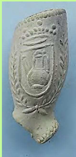
Drie Leidse pijpen uit één mal. Zie pagina 49