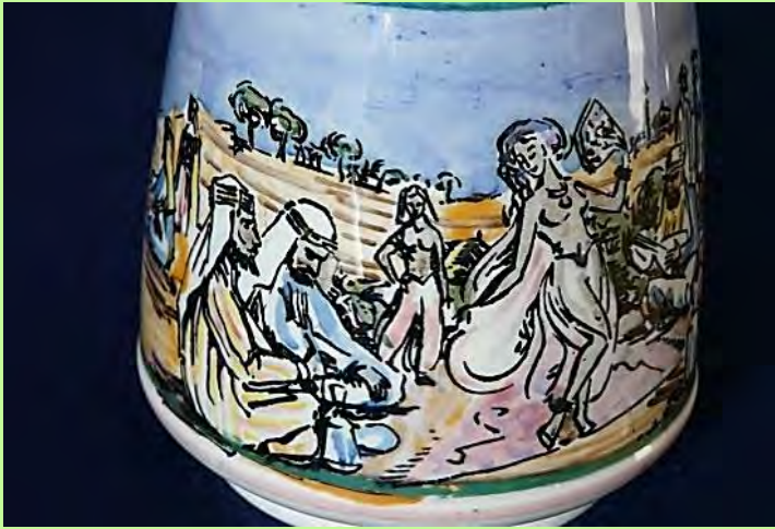
Waterpijp als jeneverfles. Zie pagina 43