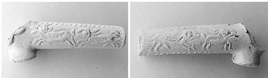
Afbeelding 4a-b. Bij Alphen gevonden steelfragmenten behorende bij type 2 pijp.

aanlopen, waarbij op de ene zijde de eerste hond omkijkt naar de tweede hond.